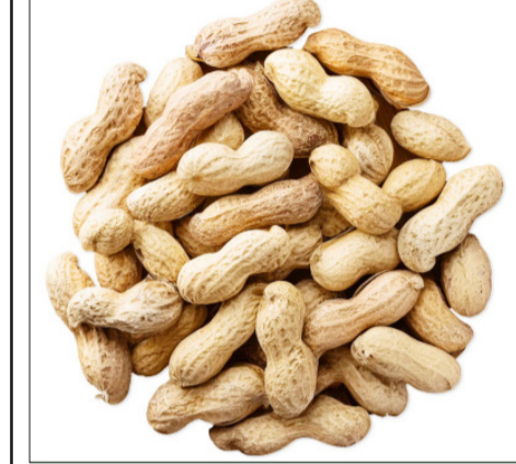
आउनुहोस्, बदामका चिकित्सा पारिदिने फाइदाबारे जानकारी लिऔं:

बदाम खानुका यस्ता छन् १० आश्चर्यलाग्दा फाइदाहरू बदाम खानु स्वास्थ्यका लागि पनि निकै फाइदाजनक छ। बदाममा स्वास्थ्यको खजाना लुकेको छ। यसमा पर्याप्त मात्रामा प्रोटीन पाइन्छ जुन शरिरको वृद्धिका लागि निकै आवश्यक हुन्छ। यदि तपाईं कुनै कारणवश दुध पिउन सक्नुहुन्न भने विश्वास गर्नुहोस् बदामको सेवन एक उत्कृष्ट विकल्प हो।